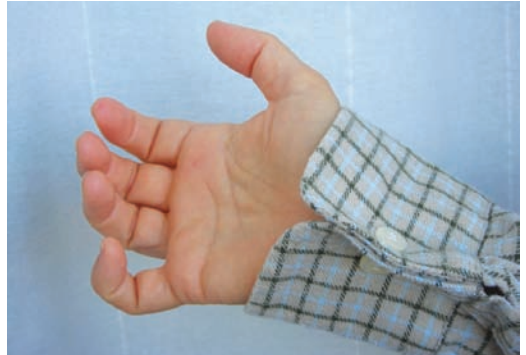
Fig. 55 - Botões duplos com elástico